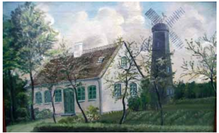
3. vindmølle er på Hollufgårdsvej 32 set fra øst ca. 1918: