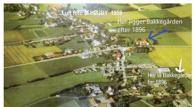
Luftfoto af Højby fra 1959 hvor den nye folkeskole netop er indviet. – På det tidspunkt var der under 800 borgere i Højby - I dag bor der over 5.500 borger i Højby (ifg. Danmarks statistik 2018)