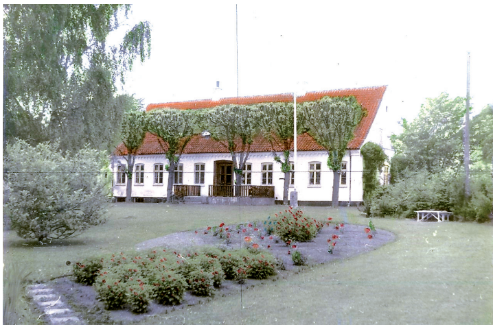
Bakkegården ca. 1950

Bakkegården har en lang og omskiftelig historie bag sig. Historien har bragt stedet fra driftig landbrugsgård over husvildebarak til det kulturhus, det er i dag.